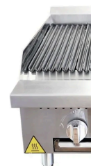
Char Broiler A High Productive