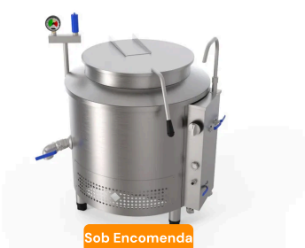
Caldeirão A Gás 100L Com Tampa Americana 79X91Cm Rc030279#...