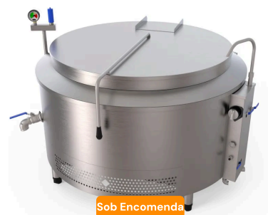
Caldeirão A Gás 500L Com Tampa Americana 145X91Cm Rc030282#...