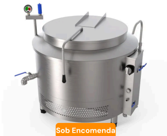
Caldeirão A Gás 200L Com Tampa Americana 105X91Cm Rc030280#...